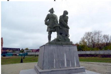
Невьянск. Памятник Петру I и Никите Демидову

В память об этом выдающемся человеке поставлены два памятника — один на Урале — в городе Невьянске, другой в Туле — на его родине.